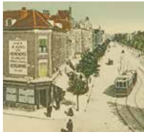
3 De geschiedenis... Het land van Hoboken