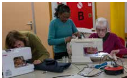
6 Werkplaats Duurzaam Repair Café, Ruilpunt en Gordijnen maken